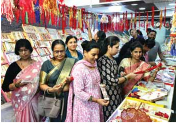
पाताल लोक में होगा भद्रा का वास